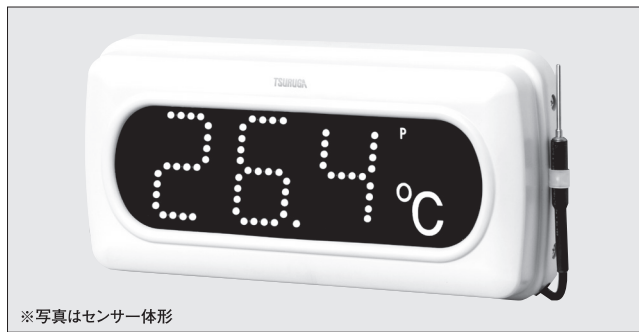
※写真はセンサー体形