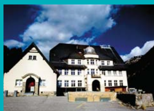
PMOD/WRC 世界放射センター(スイス)