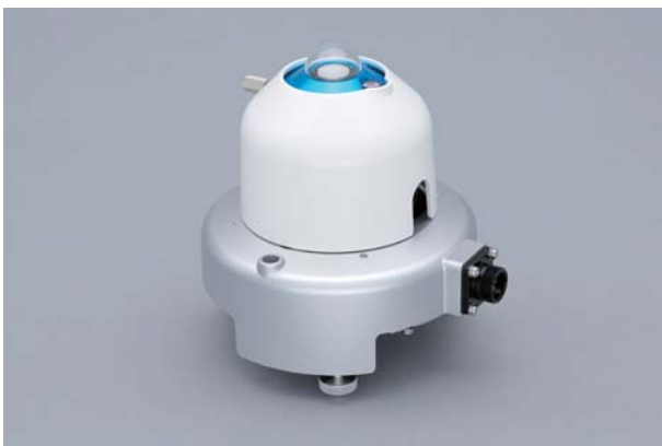
MS-80に、MV-01ファン・ヒーターユニットを取り付けたもの

ファン・ヒーターユニット [MS-80シリーズ, MS-60シリーズ, MS-40シリーズ用]