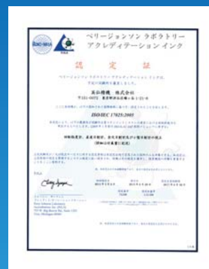
試験所・校正機関認定証