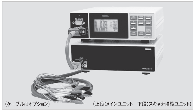
(ケーブルはオプション) (上段:メインユニット 下段:スキャナ増設ユニット)